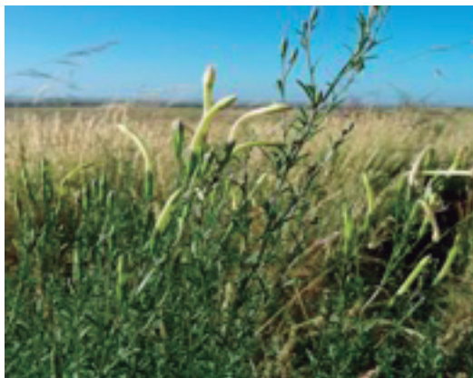
Figura 1. Sessea vestioides . Salto

En Uruguay, los Laboratorios de Diagnóstico de la Dirección de Laboratorios Veterinarios (DILAVE), estiman en un 10% los casos reportados debido a la ingestión de plantas tóxicas en bovinos en el Laboratorio Regional Noroeste de Paysandú y de 16% para el Laboratorio Regional Este de Treinta y Tres. En ovinos los porcentajes de casos reportados, son de 11% en la región noroeste y 15% en el este. Se reconocen 31 especies vegetales tóxicas de importancia pecuaria en nuestro país (Rivero y col., 2011a). Sin embargo en los últimos años, el aporte de las tesis de grado de la Facultad de Veterinaria, ha incrementado el número de plantas tóxicas reconocidas, algunas de estas incluídas en el trabajo de Rivero y col. (2011 a ) y otras estudiadas posteriormente. La toxicidad de plantas como Sessea vestioides (Figura 1) (Alonso y col., 2006), Quercus robur (Arruti y col., 2007), Senecio grisebachii (Monroy y Preliasco, 2008), Lathyrus hirsutus (Figura 2) (Aldecoa y col., 2010), Senecio madagascariensis (Arrospide y col., 2010), Melia azedarach (Alonso y Luzardo, 2011), Cestrum parqui (Bauzá y col., 2012) ha sido comprobada experimentalmente en bovinos. Mientras que en ovinos Nierembergia rivularis (Figura 3) (Etcheberry y col., 2008), Phytolaca dioica (Iriarte y col., 2011), Wedelia glauca (Figura 4) (Bertucci y Parietti, 2011), Nerium oleander (Albanell y col., 2013), Sessea vestioides (Domínguez, 2013) y Vernonia plantaginoides (Costa y col., 2014) son las especies tóxicas comprobadas.