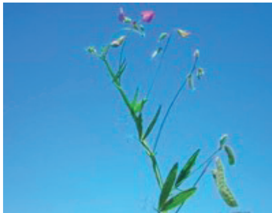
Figura 2. Lathyrus hirsutus . Canelones