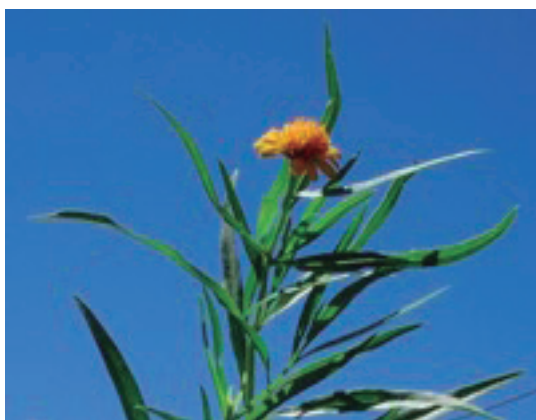
Figura 4. Wedelia glauca . Montevideo